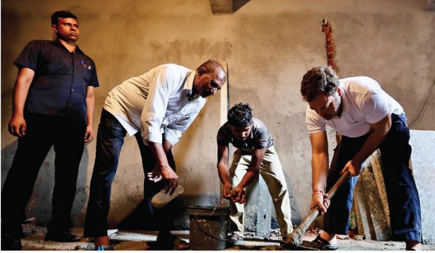
ભારત હેડલાઇન, તા.૪

કોંગ્રેસ નેતા રાહુલ ગાંધીએ આજે અચાનક નવી દિલ્હીના જીટીબીનગર પહોંચી રેંકડી-લારી પર છુટક મજૂરી કરનારા શ્રમિકોની મુલાકાત કરી હતી.