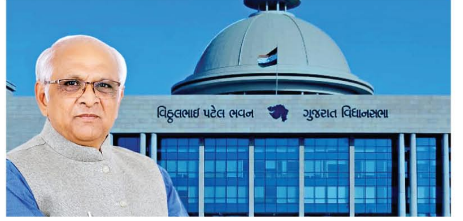
વિકુલભાઈ પટેલ ભવન ગુજરાત વિધાનસભા

મોંઘવારી ભથ્થાની ૬ માસની એટલે કે ૧ જાન્યુઆરી ૨૦૨૪થી ૩૦ જૂન ૨૦૨૪ સુધીની તફાવતની રકમ ત્રણ હપ્તામાં પગાર સાથે ચૂકવવામાં આવશે. તદઅનુસાર, જાન્યુઆરી-૨૦૨૪ તથા ફેબ્રુઆરી-૨૦૨૪ મહિનાની તફાવતની રકમ જુલાઈ-૨૦૨૪ના પગાર સાથે, માર્ચ