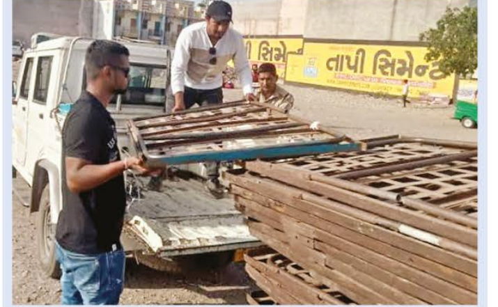
ભારત હેડલાઇન, તા.૧૩

મહાનગરપાલિકાની દબાણ હટાવ શાખા દ્વારા તા.૧ થી ૮ દરમ્યાન જુદા જુદા વિસ્તારોમાંથી ૩૮ રેંકડી, ૧૮૧ પરચુરણ સામાન, ૩૮૫ કિલો શાકભાજી અને મંજૂરી વગરના ૨૫૫ બોર્ડ-બેનર જમ કરવામાં આવ્યા હતા. અંબીકા ટાઉનશીપ, કાલાવડ રોડ, યુનિ. રોડ, સ્પિડવેલ ચોક સુધી, સાધુવાસવાણી રોડ, ઢેબર રોડ, જામનગર રોડ, ટાગોર રોડ, રેસકોર્ષ રિંગરોડ, સંતકબીર રોડ, પેડક રોડ, ભાવનગર રોડ પરથી ૨૫૫ બોર્ડ-બેનર જમ કરેલા છે શહેરના જ્યુબેલી માર્કેટ, જામનગર રોડ, ગુંદાવાડી, ગાયત્રીનગર મેઈન રોડ, આહીર ચોક મવડી મેઈન રોડ, પુષ્કરધામ મેઈન રોડ, ભીમનગર મેઈન રોડ, રામાપીર ચોકડી પાસેથી રસ્તા પર નડતર રૂપ ૩૮ રેંકડી, કેબીન જમ કરવામાં આવી હતી, જ્યોતિનગર, નાણાવટી ચોક, પંચાયત ચોક, ગોવિંદબાગ, નાના મૌવા મેઈન રોડ, આનંદબંગલા ચોક, અર્ટીકા, રવિરત્ન પાર્ક, માધાપર ચોકડી, જામનગર રોડ, કોર્ટ ચોક, ગાયત્રીનગર, હોસ્પિટલ ચોકડી પરથી જુદીજુદી અન્ય ૧૮૧ પરચુરણ ચીજ વસ્તુઓ જમ કરાઈ હતી. જ્યારે જંકશન રોડ, જ્યુબેલી, પંચાયત ચોક, રામાપીર ચોકડી, પુષ્કરધામ મેઈન રોડ, માધાપર રિંગ રોડ, લક્ષ્મિનગર નાલા પાસેથી ૩૮૫ કિલો શાકભાજી, ફળ જમ કરી પુષ્કરધામ મેઈન રોડ, નાણાવટી ચોક, રૈયા રોડ, નંદનવન, મવડી વિસ્તાર, મટકી ચોક, સ્વામીનારાયણ ચોક પરથી રૂ.૧૭,૫૦૦ મંડપ કમાન છાજલી ભાડુ વસુલ કરાયું હતું. જ્યારે કોઠારીયા રોડ, મોરબી રોડ, ભાવનગર રોડ, કુવાડવા રોડ ૮૦ફુટ રોડ, અર્ટીકા ફાટક, જામનગર રોડ, ટાગોર રોડ, આનંદબંગલા ચોક, મવડી મેઈન રોડ, આહીર ચોક પરથી રૂ.૭,૫૦૦ વહિવટી ચાર્જ વસુલ કરવામાં આવ્યો હતો.