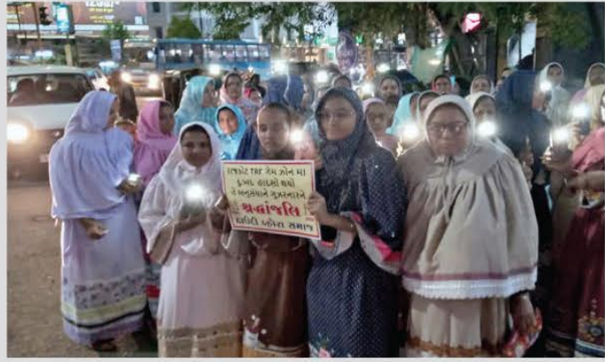
ભારત હેડલાઇન, તા.૨૯

રાજકોટમાં ટીઆરપી ગેમ ઝોનના અગ્નિકાંડમાં મૃત્યુ પામેલા મૃતાત્માઓની શાંતિ માટે રાજકોટના ભગવતીપરા બેડીપરામાં દાઉદી વ્હોરા સમાજ દ્વારા શ્રદ્ધાંજલી અર્પવામાં આવી હતી.